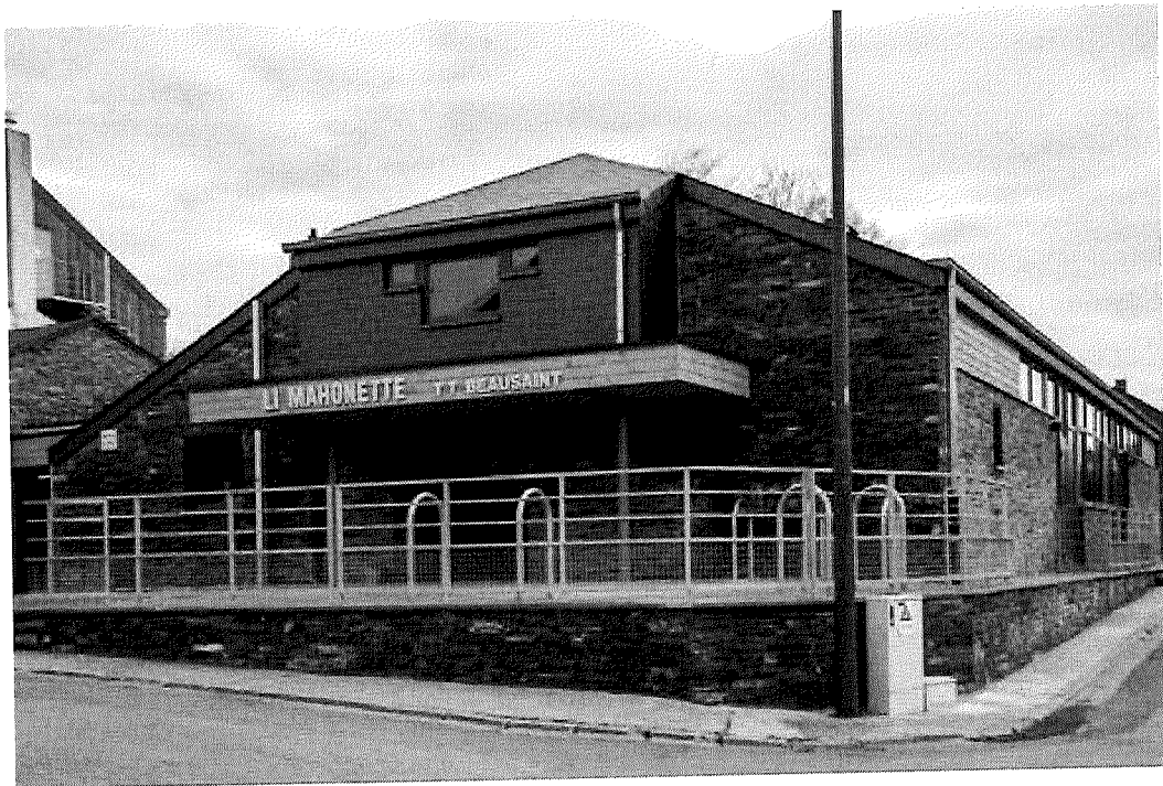
Rénovation de la salle de Beausaint, projet DR.

PROGRAMME COMMUNAL DE DEVELOPPEMENT RURAL ANNEE 2025 : RAPPORT ANNUEL